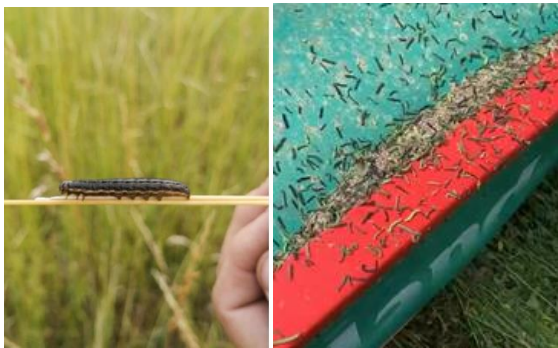
Fotografías. Gusano soldado.

Por otra parte desde la Gerencia Técnica de OGANA se realizó una encuesta breve a socios para detectar más finamente la problemática, los resultados en gráfico N°01, adjunto.